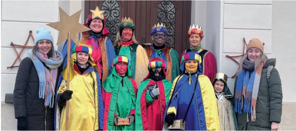
» Gruppenfoto der Sternsinger in Dietersdorf

en, zukünftig mehr Kinder, Jugendliche, aber auch Erwachsene für die Aktion zu begeistern. Bereit zu sein, sich für Bedürftige in der Welt einzusetzen und für sie eine Spende zu erbitten.