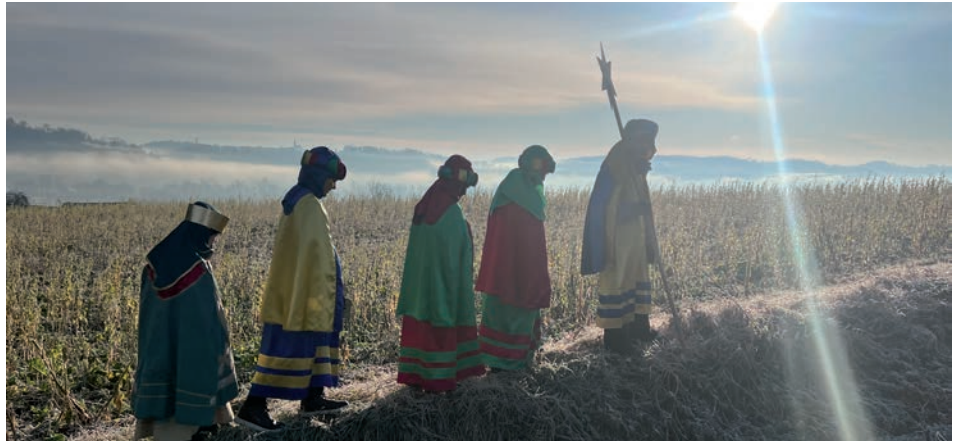
» Sternsinger sind in Dietersdorf auf dem Weg von Haus zu Haus

Beim Sternsingen sind wir mit Menschen solidarisch, die unsere Hilfe dringend benötigen. Rund 500 Hilfsprojekte werden mit den Spenden jährlich unterstützt. Zum Beispiel in Guatemala. Trotz Friedensschluss nach dem grausamen Bürgerkrieg leben fast 60 Prozent der Bevölkerung in Armut. Kinder und Jugendliche sind besonders betroffen.