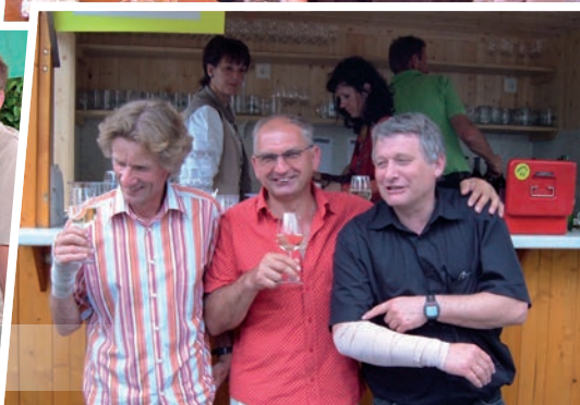
Bilder vom Pfarrfest in Tieschen