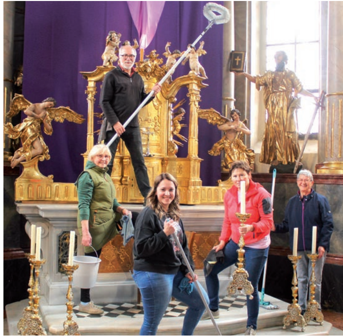
» In Straden reinigen die Dorfbewohner die Kirchen

Mit dieser Ausgabe des Pfarrblattes starten wir mit der neuen Rubrik „ Ehrenamt und Freiwilligen-Arbeit in unseren Pfarren “. Exemplarisch möchten wir uns bei den Freiwilligen damit bedanken, die unentgeltlich unverzichtbare Dienste in unseren Pfarren leisten. Exemplarisch deshalb, weil es den Rahmen unseres Pfarrblattes sprengen würde, wenn wir zum Beispiel alle, die ehrenamtlich in unserer Pfarrgemeinschaft mitarbeiten, einzeln aufzählen würden, beziehungsweise mit einem Foto abbilden würden. Es dürfen sich aber alle bedankt wissen, die in den einzelnen Bereichen der Pfarre Straden, der Seelsorgestelle Dietersdorf und der Pfarre Tieschen mitarbeiten.