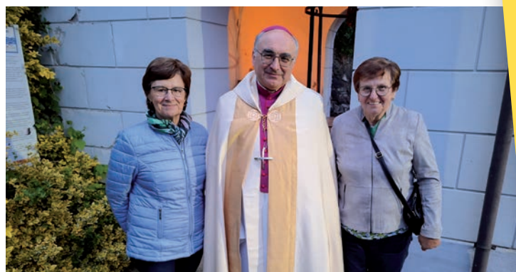
» Leopoldine Schantl und Anneliese Wonisch aus Radochen mit Bischof Wilhelm Krautwaschl in Helfbrunn